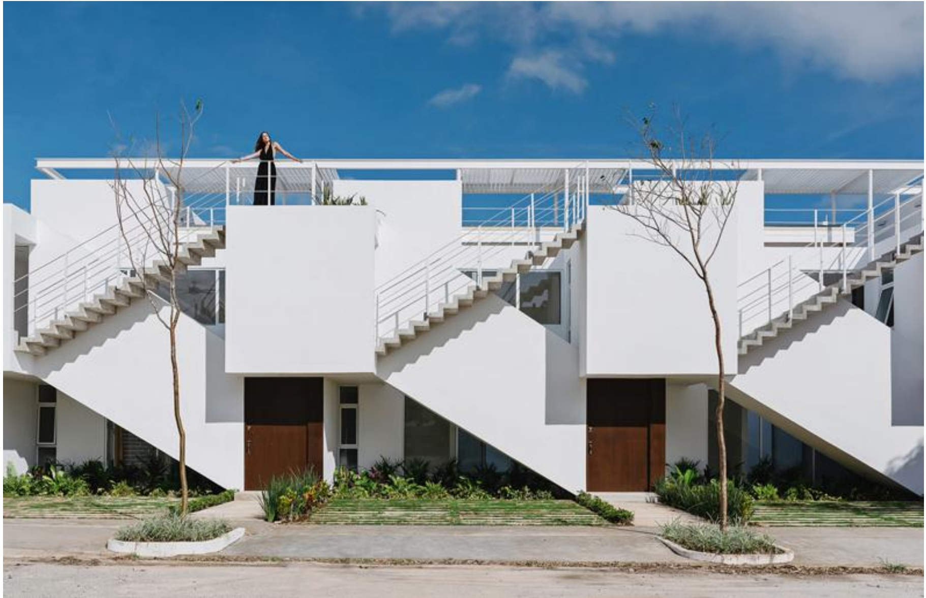
EJERCICIO 2. VIVIENDA Y CIUDAD.